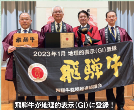
飛騨牛が地理的表示(GI)に登録!

生産・加工・流通に関わる関係者の皆様におかれましては、「飛騨牛」が国内はもとより世界中で認められたブランドであることを誇りに、一層の飛躍に向けてそれぞれの立場でご尽力賜りますようお願い申し上げます。GI登録にあたっての飛騨牛銘柄推進協議会からのメッセージとさせていただきます。