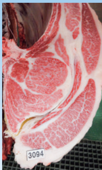
最優秀賞カット面